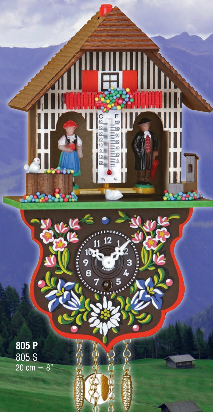
805 P 805 S 20 cm = 8"