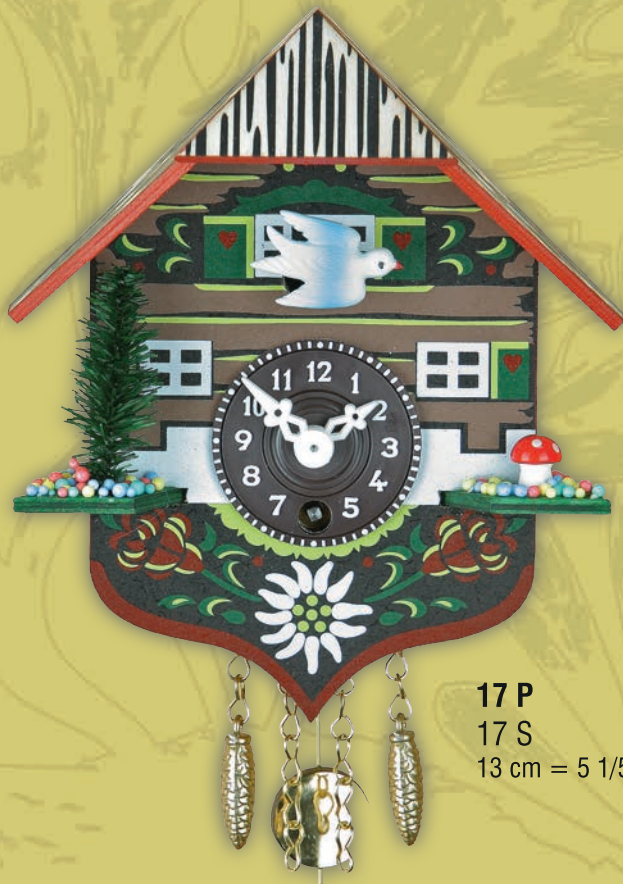
17 P 17 S 13 cm = 5 1/5"