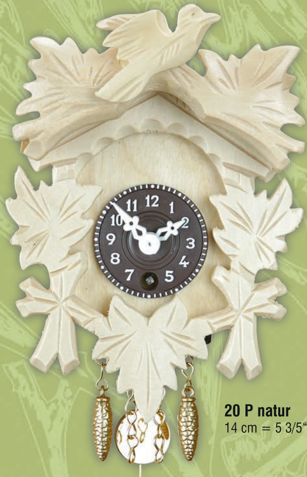
20 P natur 14 cm = 5 3/5"