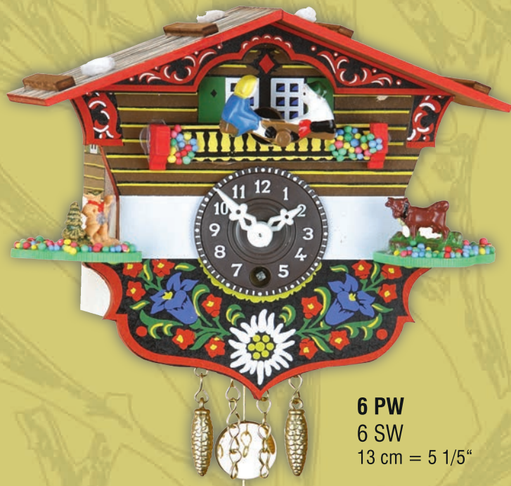
6 PW 6 SW 13 cm = 5 1/5"