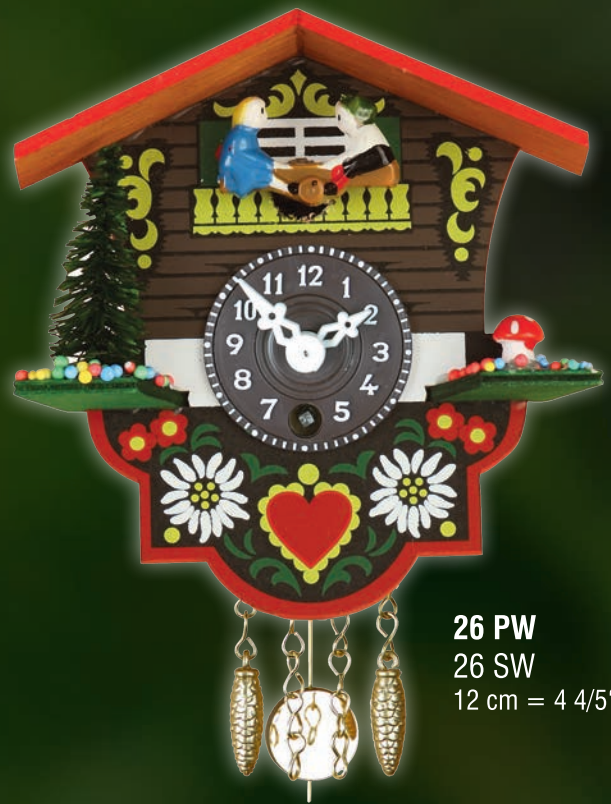
26 PW 26 SW 12 cm = 4 4/5"