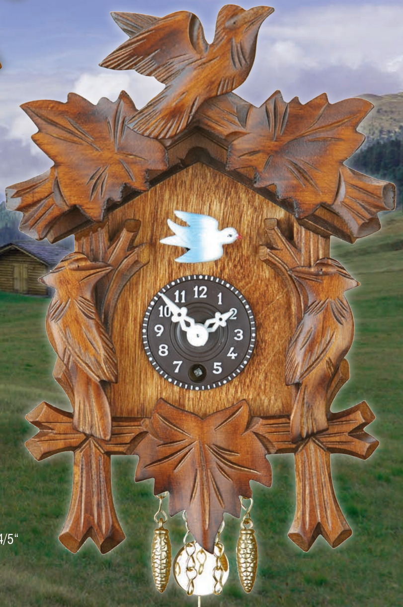
72 P nu 72 S nu 17 cm = 6 4/5"