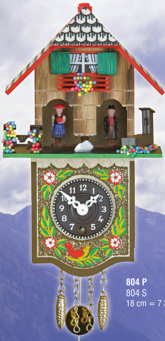
804 P 804 S 18 cm = 7 3/5"