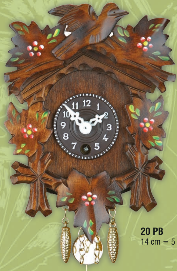
20 PB 14 cm = 5 3/5"