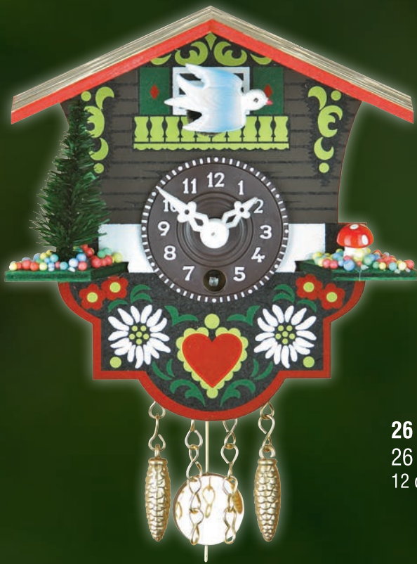
26 P 26 S 12 cm = 4 4/5"