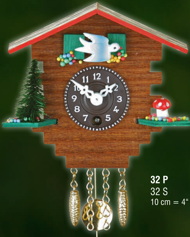
32 P 32 S 10 cm = 4"