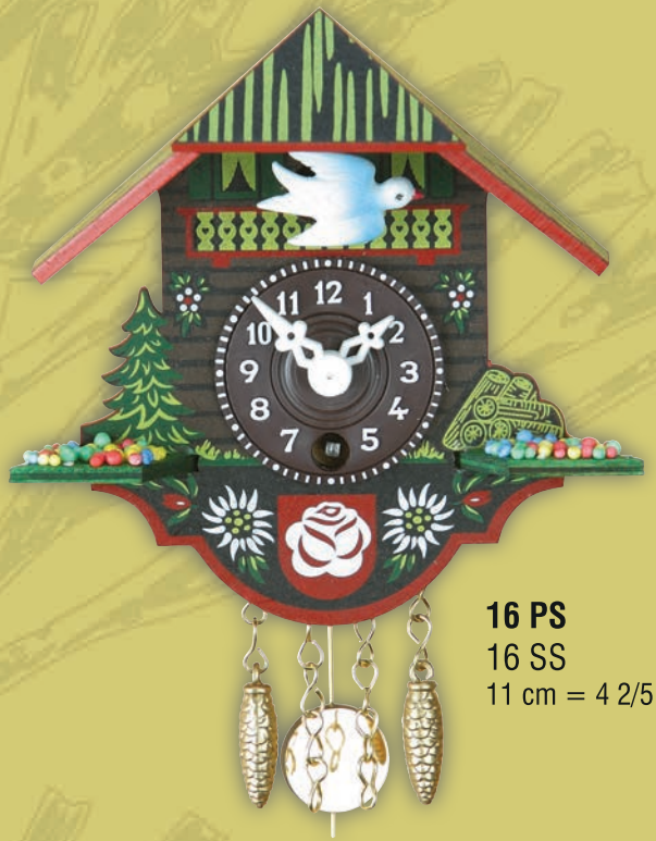
16 PS 16 SS 11 cm = 4 2/5"