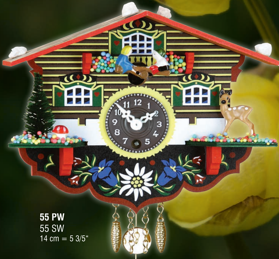
55 PW 55 SW 14 cm = 5 3/5"