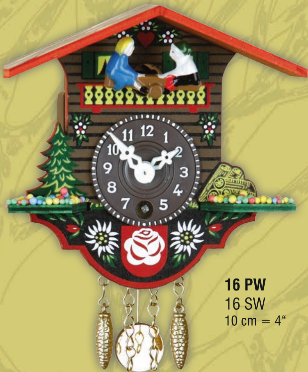
16 PW 16 SW 10 cm = 4"