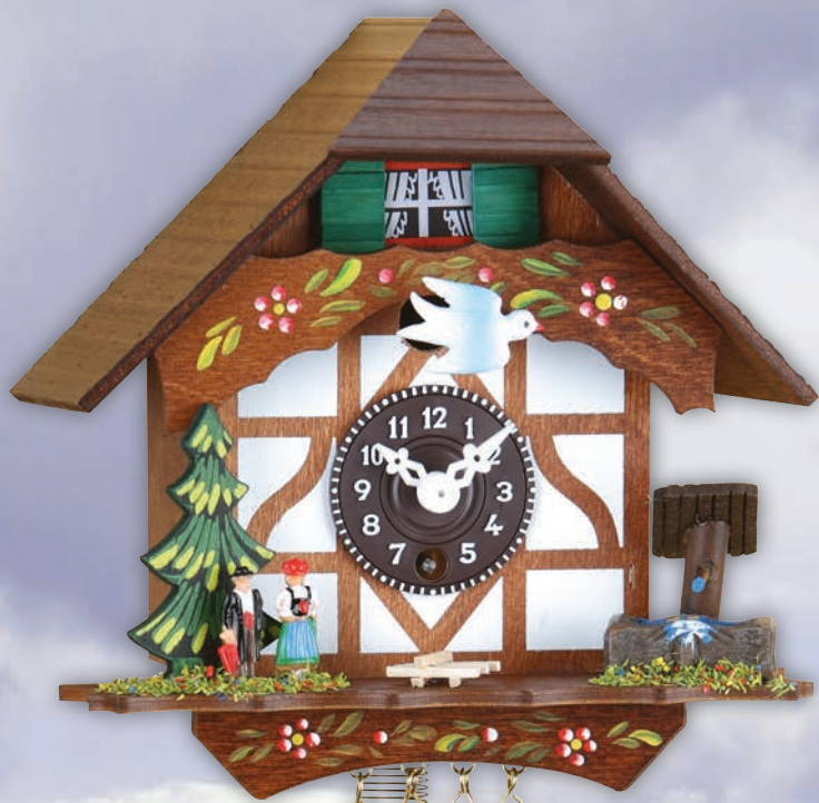
106 P 106 S 15 cm = 6" handbemalt handpainted peint à la main