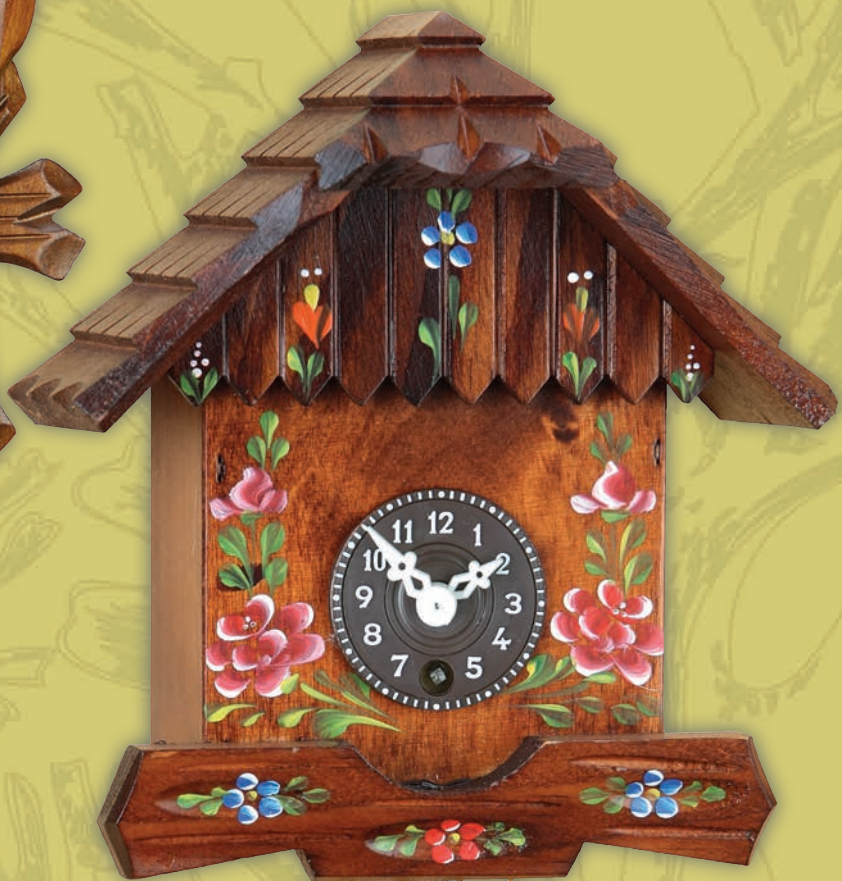
73 SB 16 cm = 6 2/5" handbemalt handpainted peint à la main