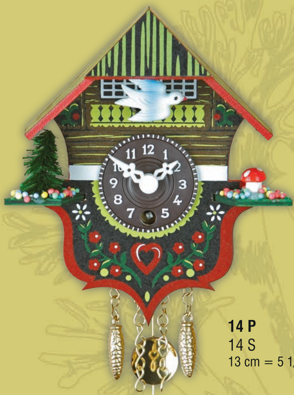
14 P 14 S 13 cm = 5 1/5"