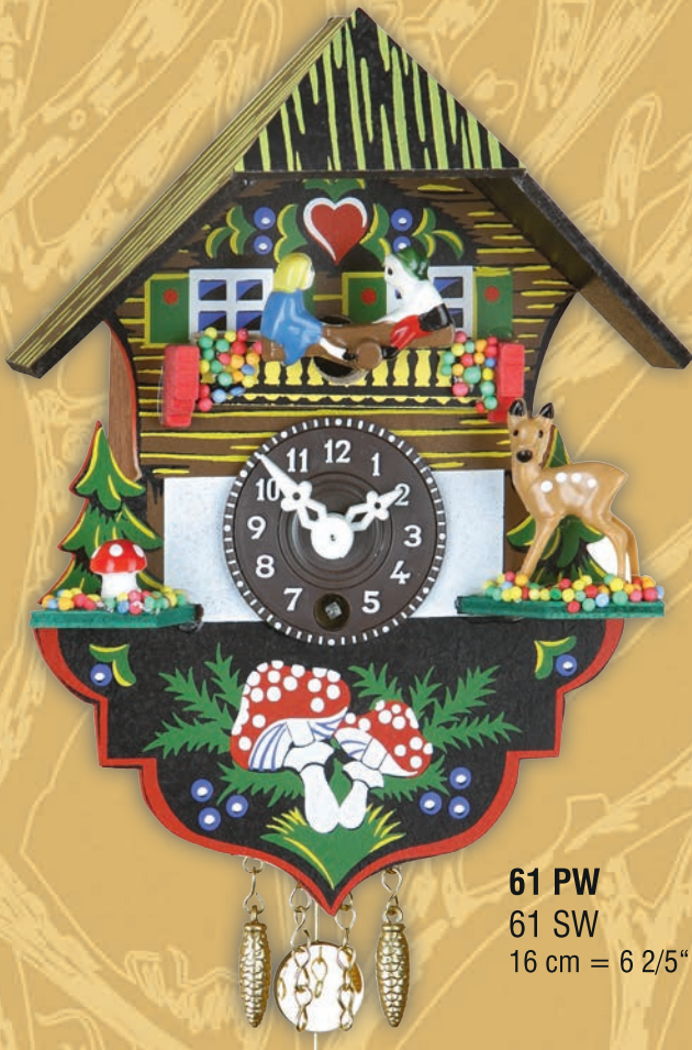
61 PW 61 SW 16 cm = 6 2/5"