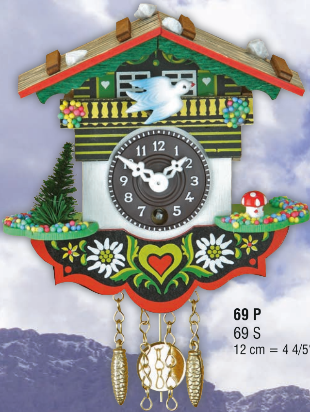
69 P 69 S 12 cm = 4 4/5"