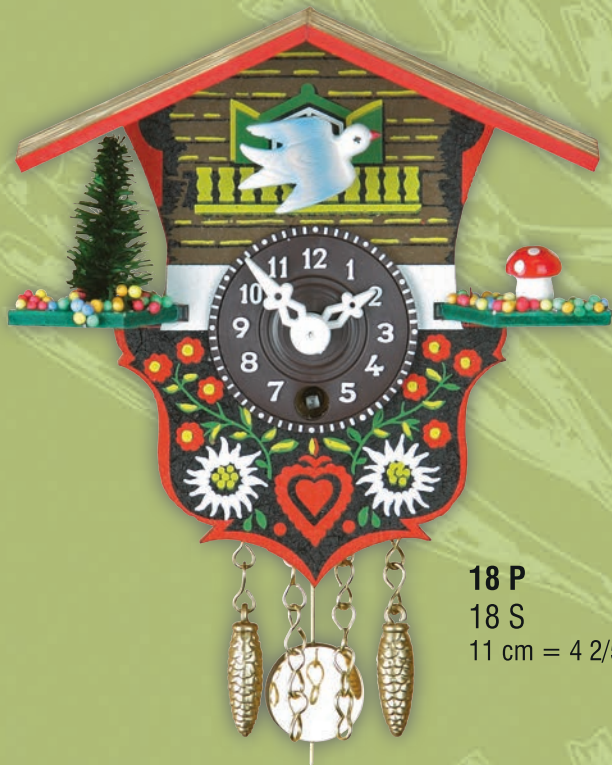
18 P 18 S 11 cm = 4 2/5"