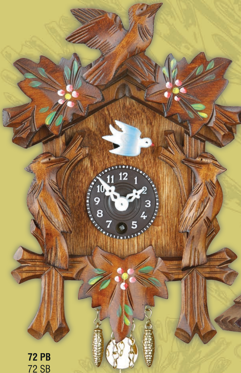
72 PB 72 SB 17 cm = 6 4/5" handbemalt handpainted peint à la main