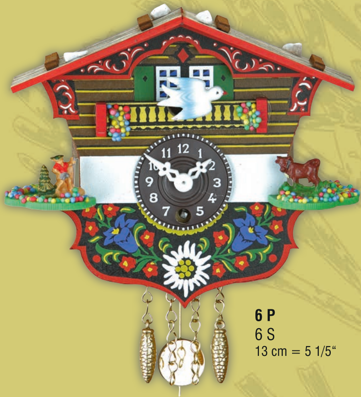
6 P 6 S 13 cm = 5 1/5"