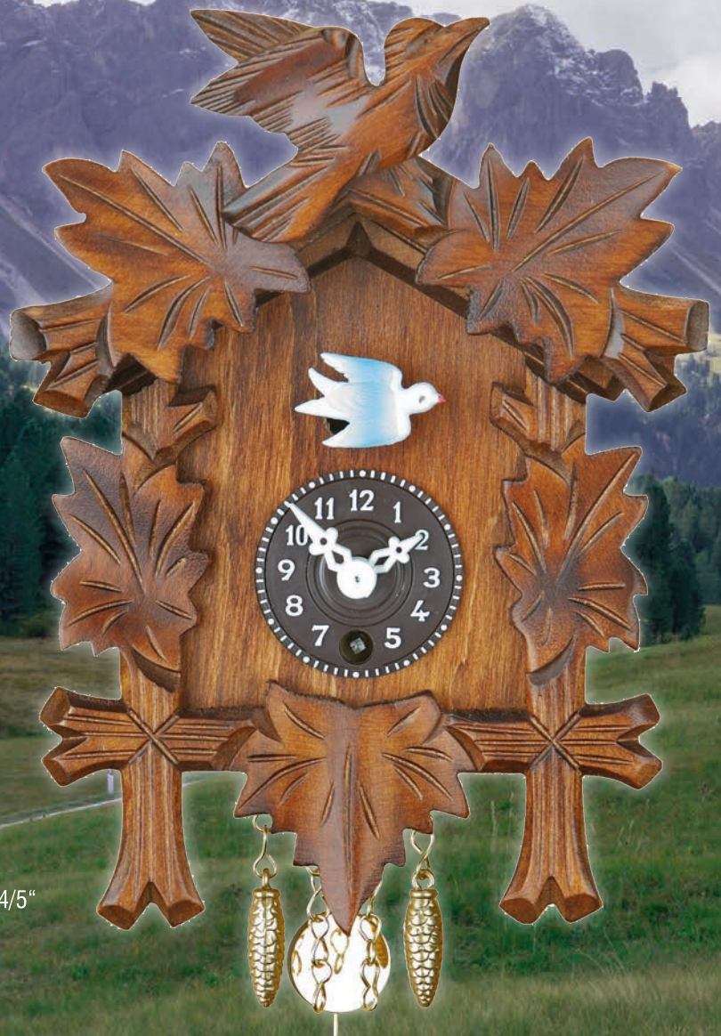
70 P nu 70 S nu 17 cm = 6 4/5"