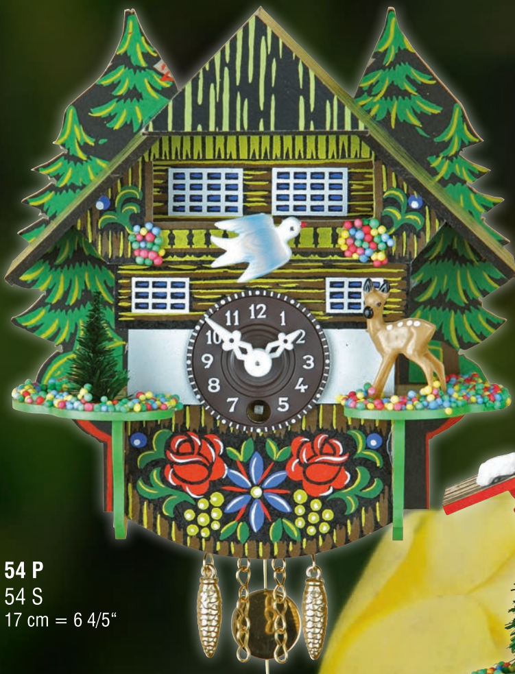
54 P 54 S 17 cm = 6 4/5"