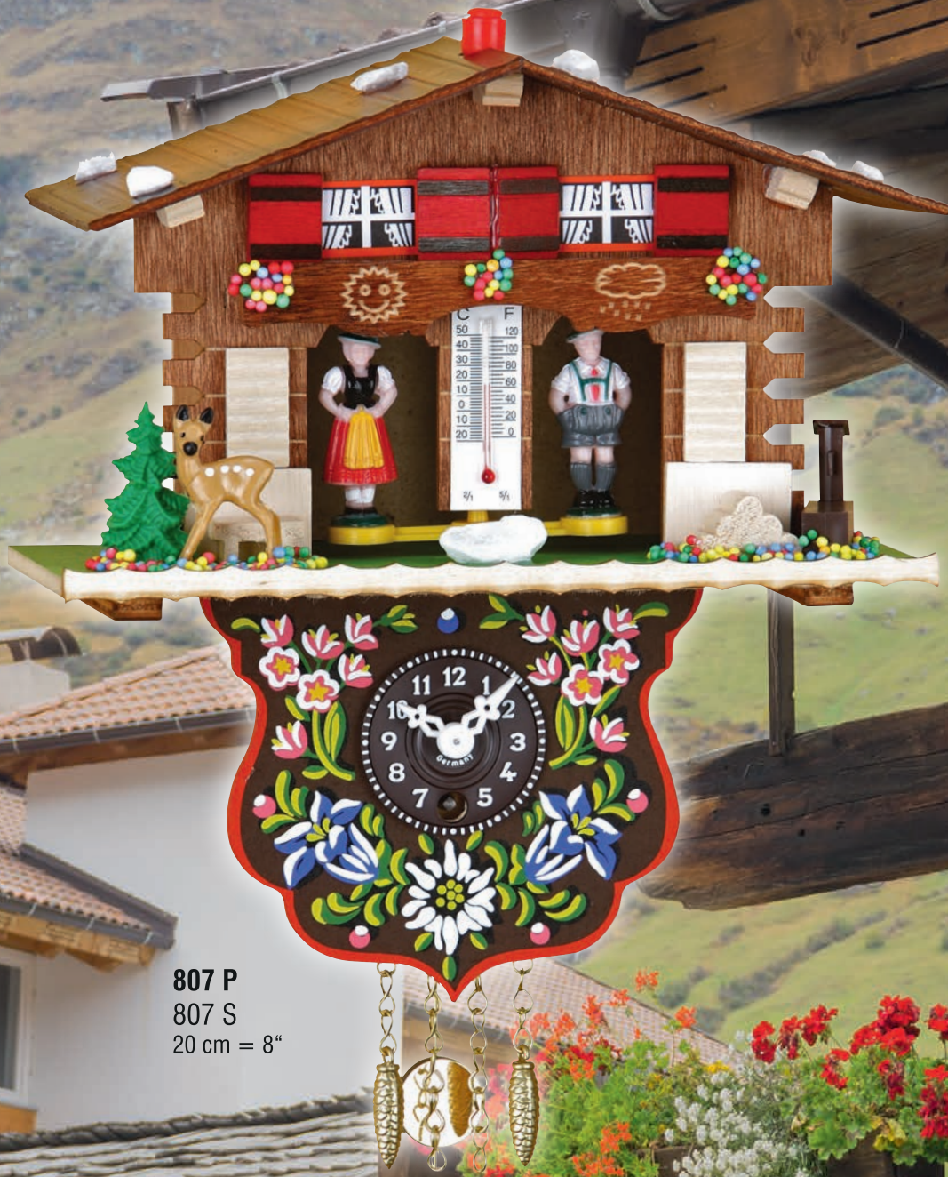
807 P 807 S 20 cm = 8"