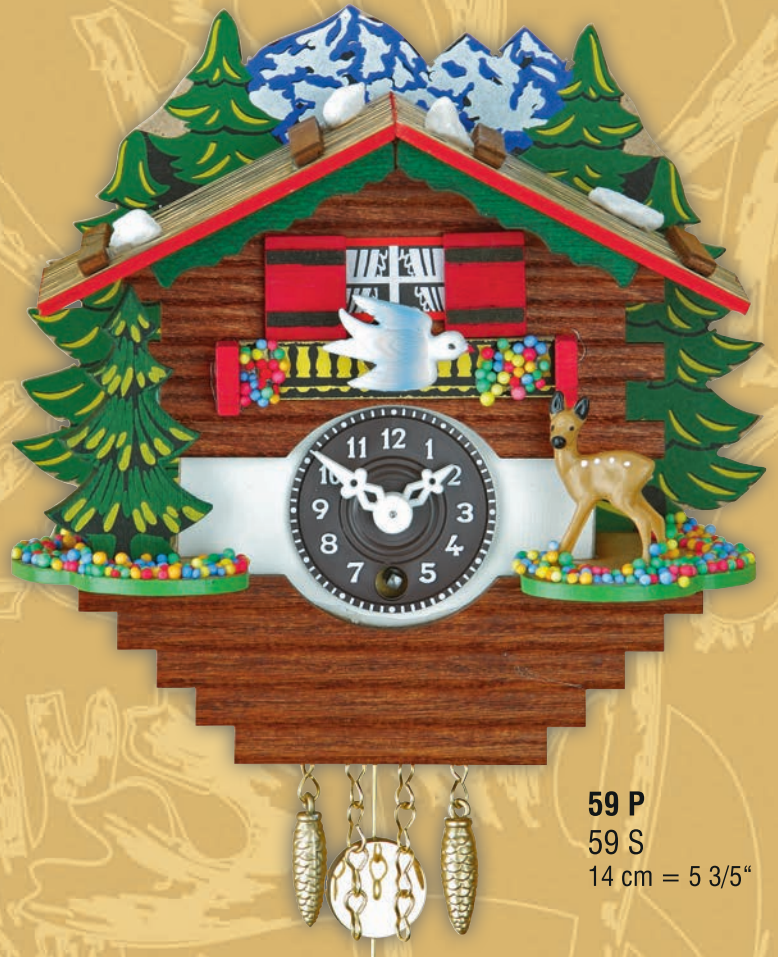
59 P 59 S 14 cm = 5 3/5"