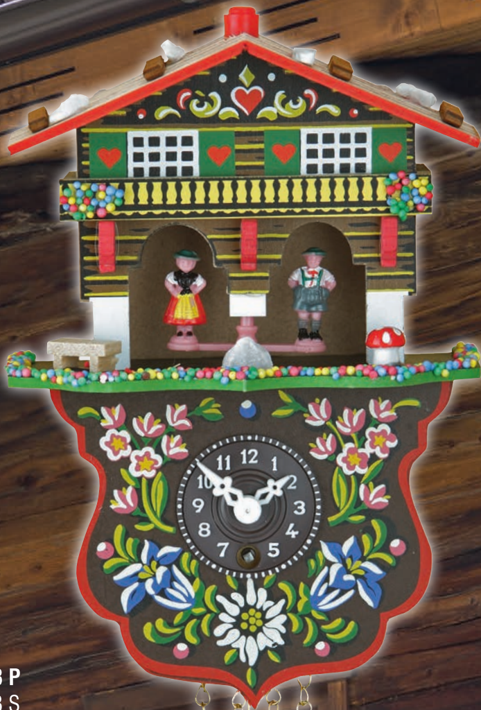
808 P 808 S 19 cm = 7 3/5"