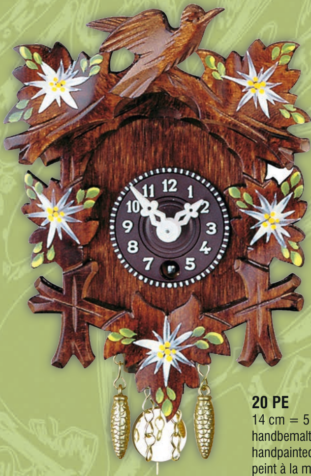
20 PE 14 cm = 5 3/5" handbemalt handpainted peint à la main