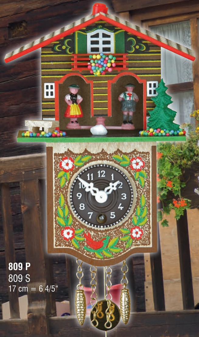
809 P 809 S 17 cm = 6 4/5"