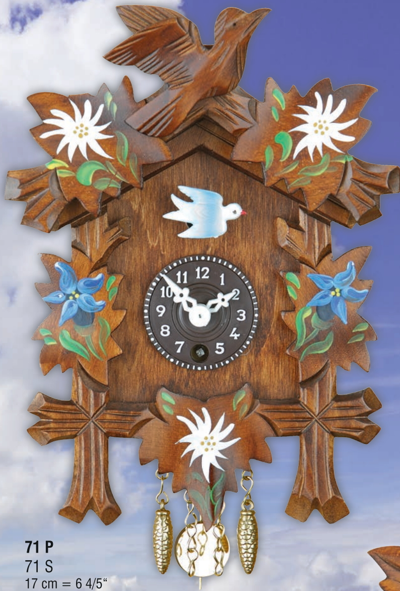
71 P 71 S 17 cm = 6 4/5"