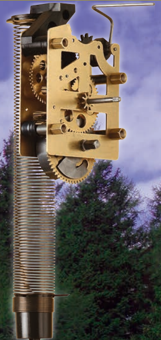
1-Tag-Federzugwerk mit Schaukelpuppe