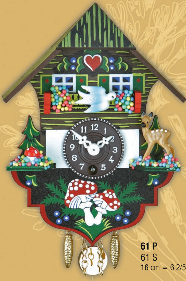
61 P 61 S 16 cm = 6 2/5"