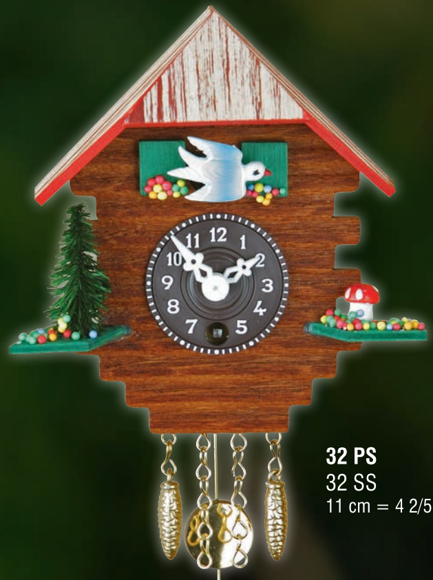
32 PS 32 SS 11 cm = 4 2/5"