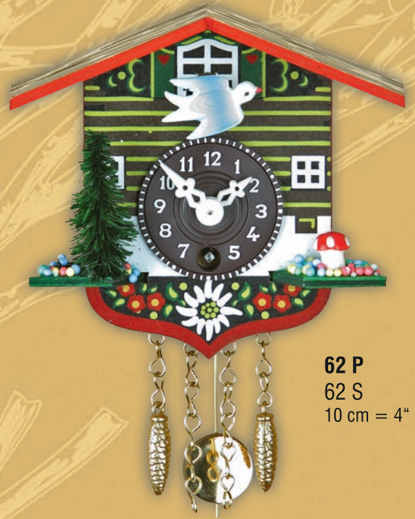
62 P 62 S 10 cm = 4"