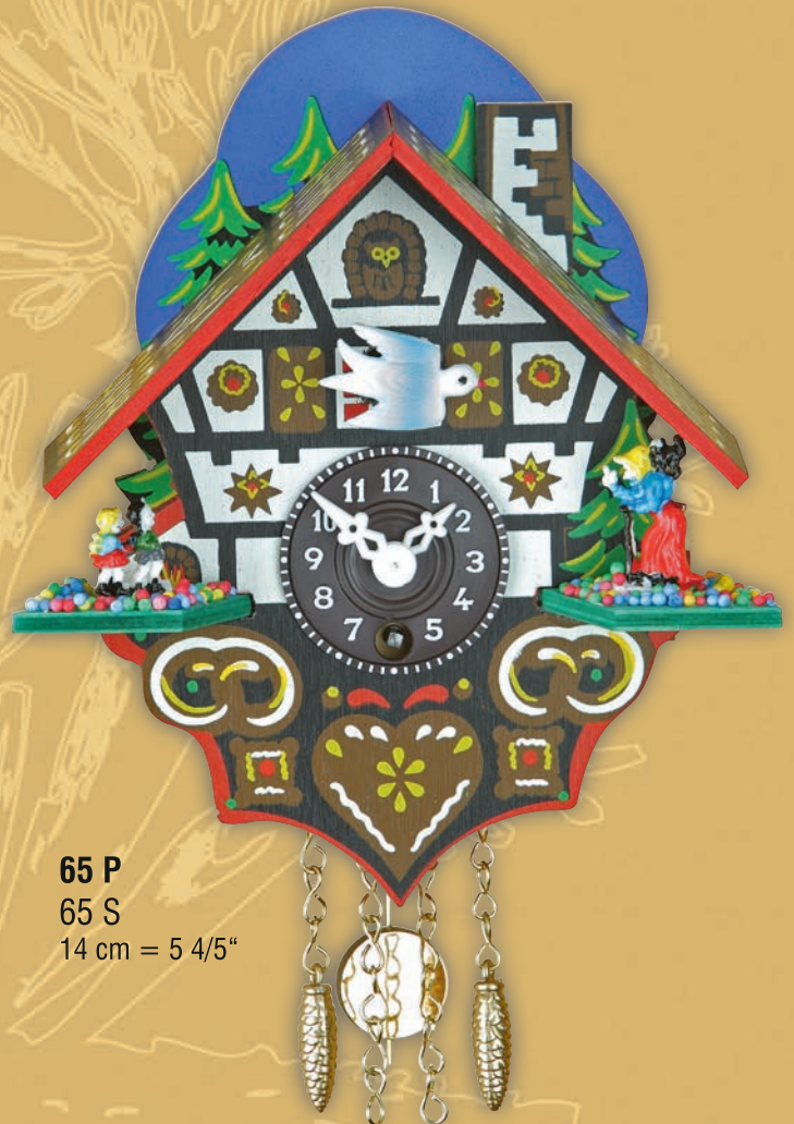
65 P 65 S 14 cm = 5 4/5"