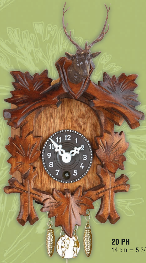
20 PH 14 cm = 5 3/5"