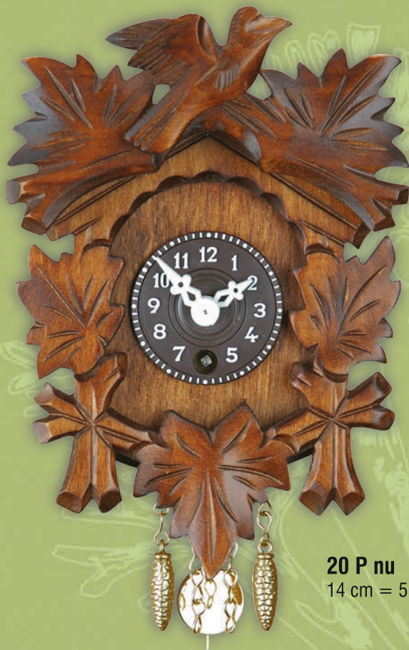
20 P nu 14 cm = 5 3/5"