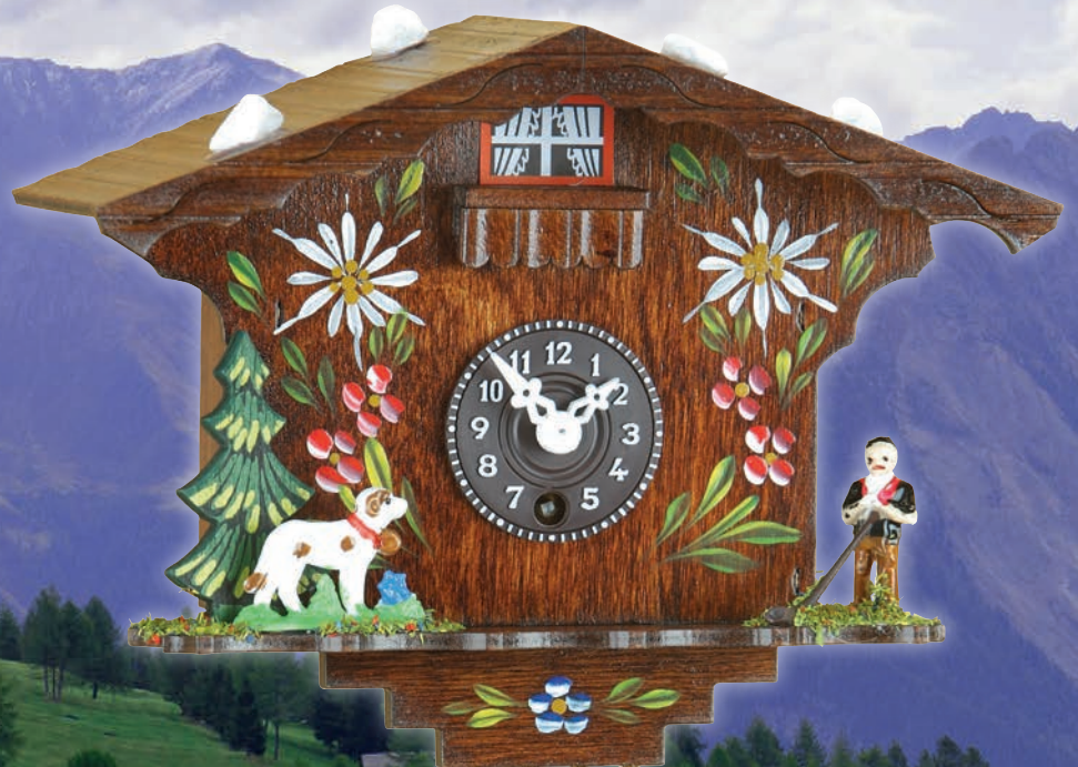
107 P 107 S 15 cm = 6" handbemalt handpainted peint à la main