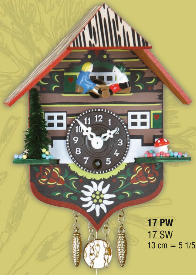
17 PW 17 SW 13 cm = 5 1/5"