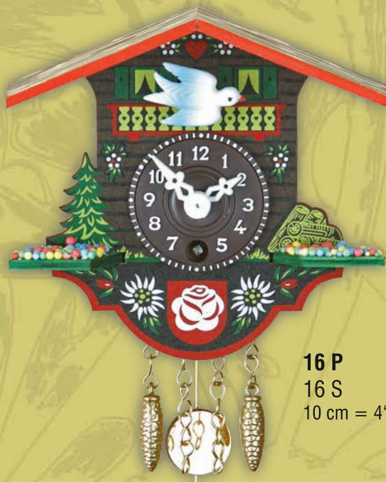
16 P 16 S 10 cm = 4"