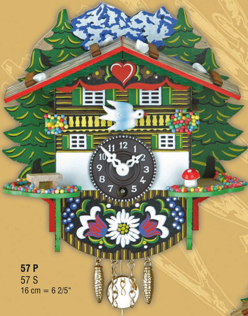
57 P 57 S 16 cm = 6 2/5"